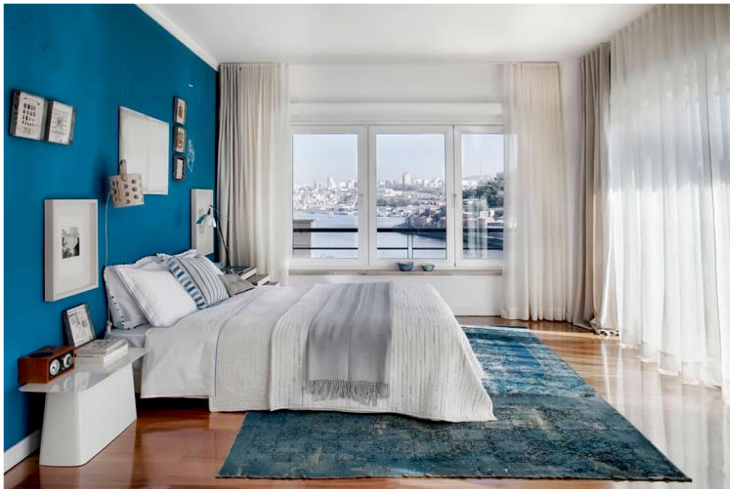
В спальне тёмно-синюю стену украшают картины, стикеры и шелкография. Из окна открывается вид на Дуэро. Шторы — Pedroso&Osorio.

кофейная стена — кофейный столик, — а ковёр на полу поддерживает все три заданные темы. Ещё одна рифма, только уже не цветовая, а смысловая — стулья Egg Арне Якобсена и Bird Гарри Бертойи. Здесь же на стенах — довольно неожиданное в португальском интерьере «варенье» кириллицей — серия работ литовской художницы Жанеты Ясайтите. Столовая и кухня выполнены в той же гамме, а их спокойный минимализм также разбавлен всплесками цвета — картинами португальских художников.