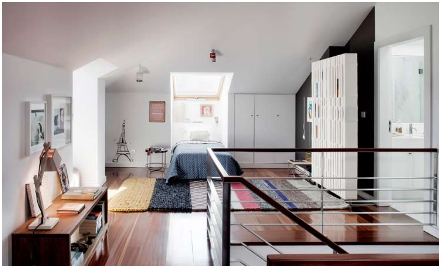
Ковёр Gandia Blasco — единственное яркое цветное пятно, в остальном этаж старшей дочери оформлен в спокойных оттенках. К комнате-студии примыкает отдельная ванная.