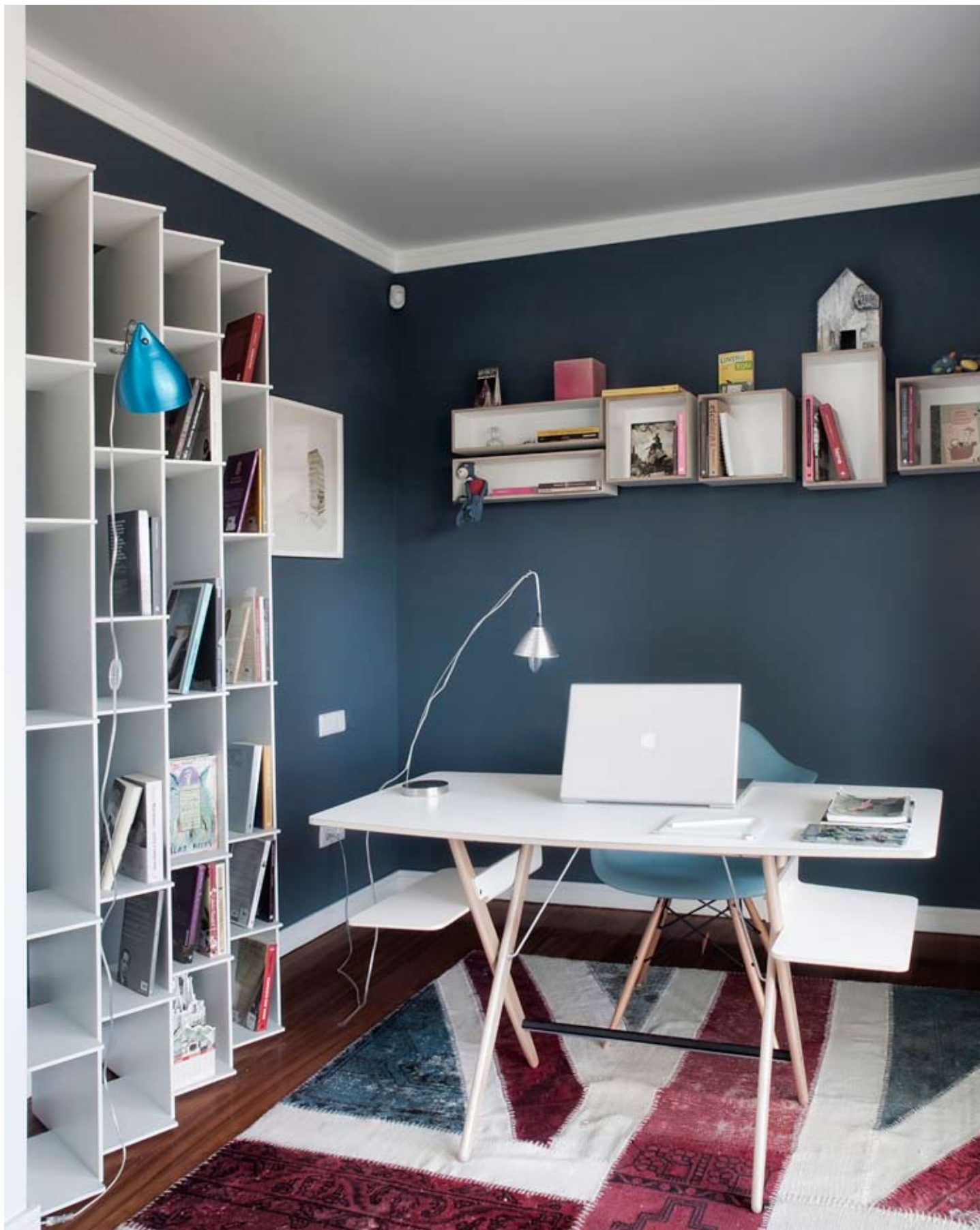
Белый стол для занятий в кабинете младшей дочери — произведение Акилле Кастильоне. Стул, гармонирующий по цвету с фрагментами «британского» ковра, — швейцарской фабрики Vitra.