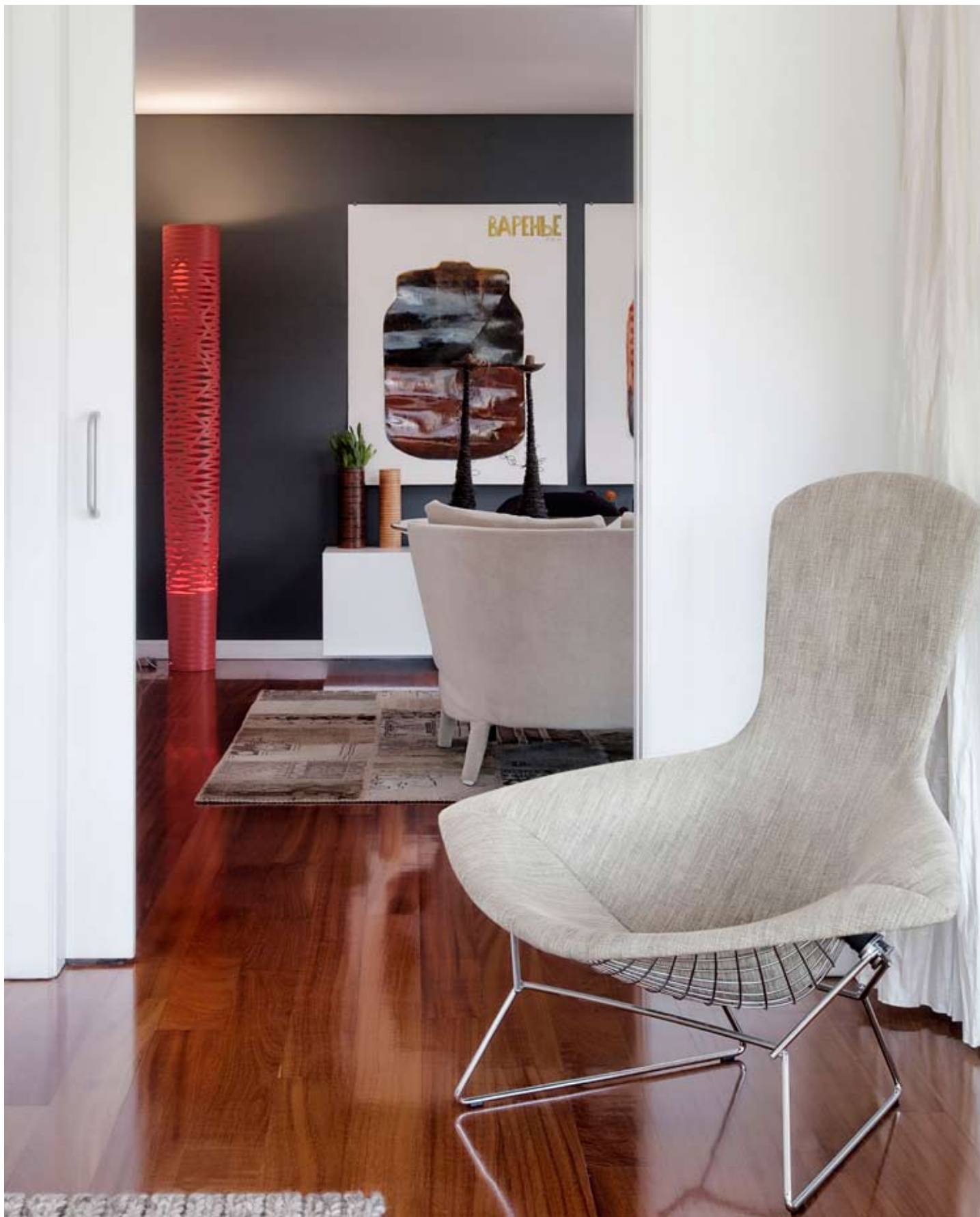
Кресло Bird, который знаменитый дизайнер Гарри Бертойя спроектировал ещё в 1952 году, отлично вписалось в современный минималистичный интерьер. Ковёр пастельных тонов в столовой на заднем плане — Gandia Blasco.