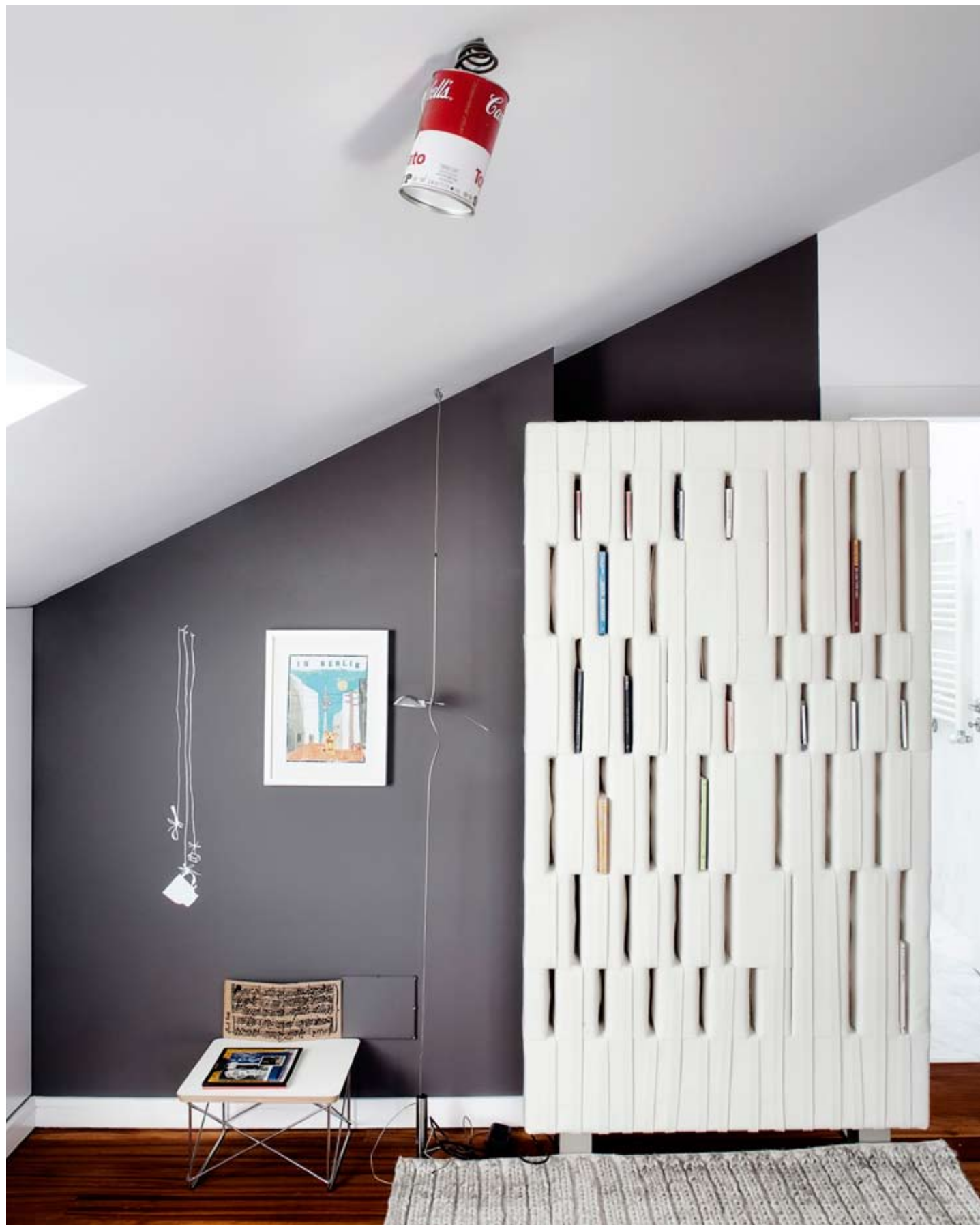
В комнате старшей дочери насыщенно-серый оттенок одной из стен контрастирует с основным белым тоном. Потолочный и настенные светильники — авторства немецкого дизайнера Инго Маурера.