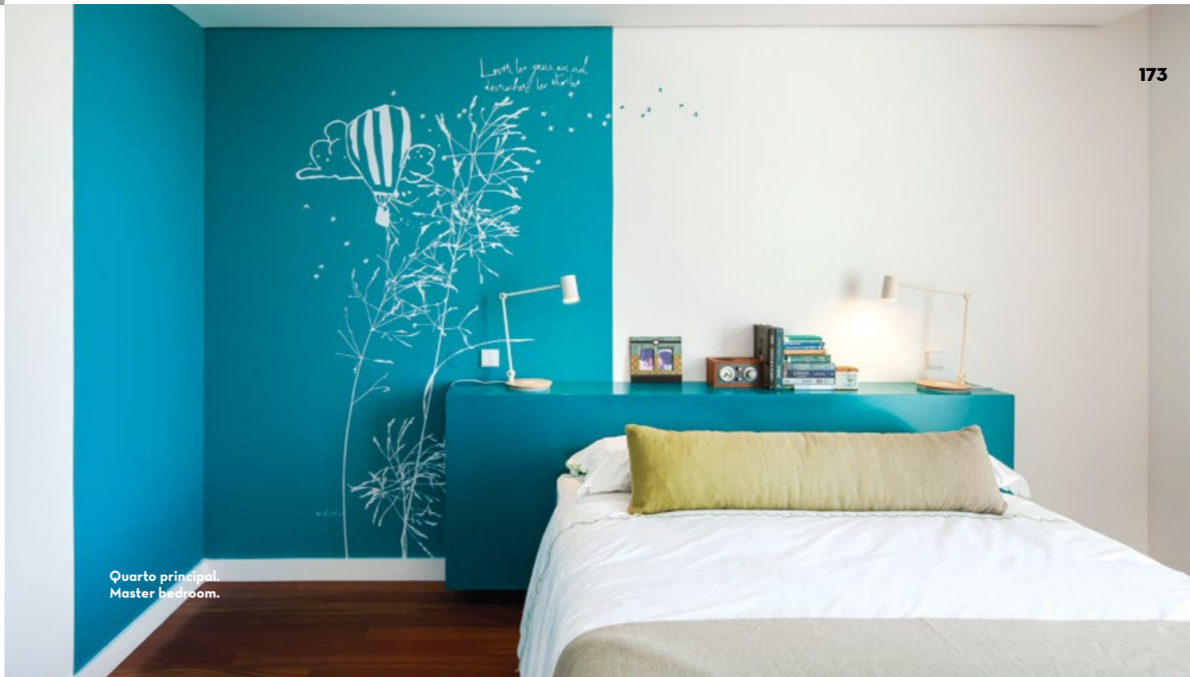
Quarto principal. Master bedroom.