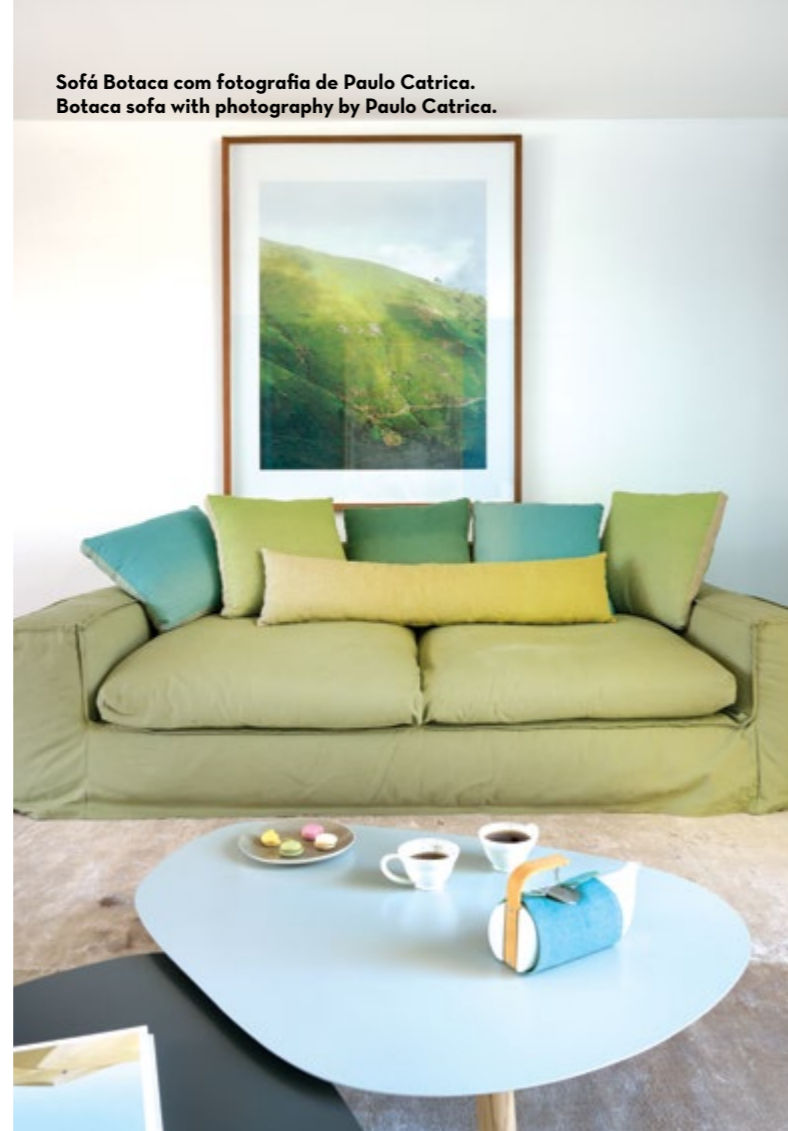
Sofá Botaca com fotografia de Paulo Catrica. Botaca sofa with photography by Paulo Catrica.