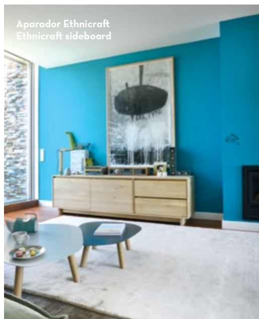
Aparador Ethnicraft Ethnicraft sideboard