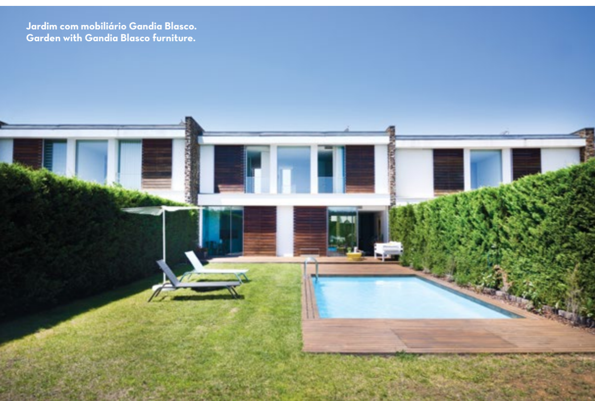
Jardim com mobiliário Gandia Blasco. Garden with Gandia Blasco furniture.