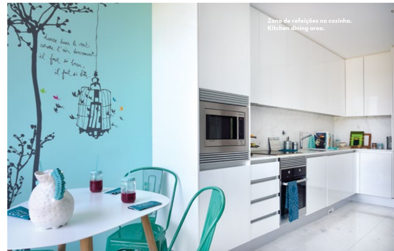
Zona de refeições na cozinha. Kitchen dining area.