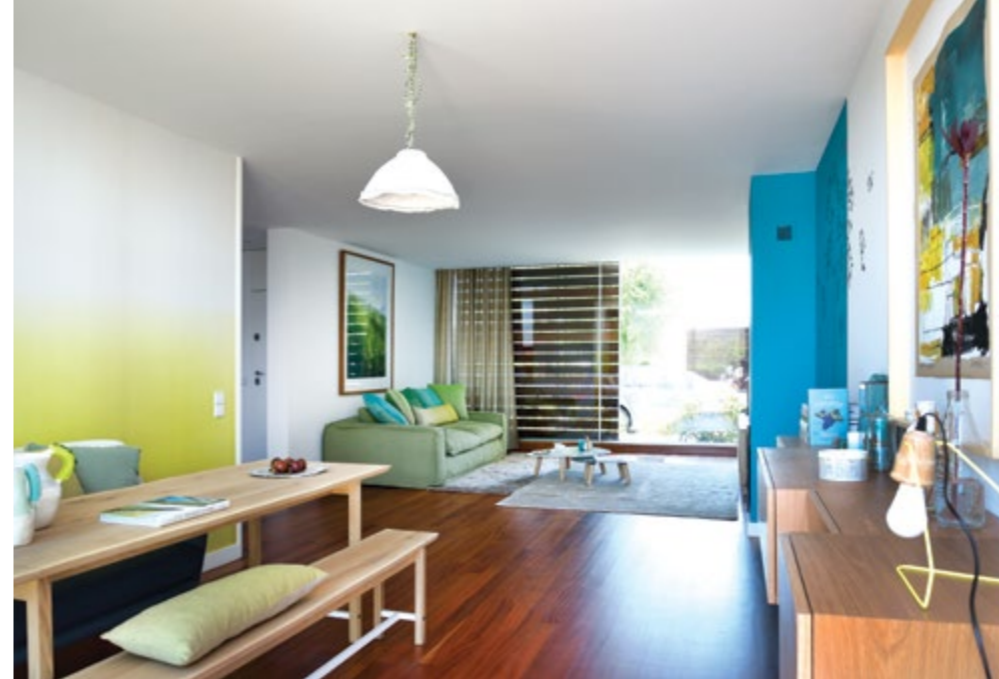
Vista do jardim para o interior da sala; quadro de Graça Paz. Mobiliário Atelier Lígia Casanova.

It's time to go up to the first floor, where we take a peek at the daughter's room, with its relaxed style, and the couple's bedroom, with a small closet in the passage to the bathroom. Part of its two walls are painted in the same green colour and the bed is framed by a lacquered blue sideboard. On the veranda, a table and chairs by Gandia Blasco offer moments of relaxation, with refreshing views over the garden. By embellishing the home with these colours, the aim was to bring the colours of the garden inside the home, giving it a colourful, happy and playful atmosphere, especially because a second child is now on the way.