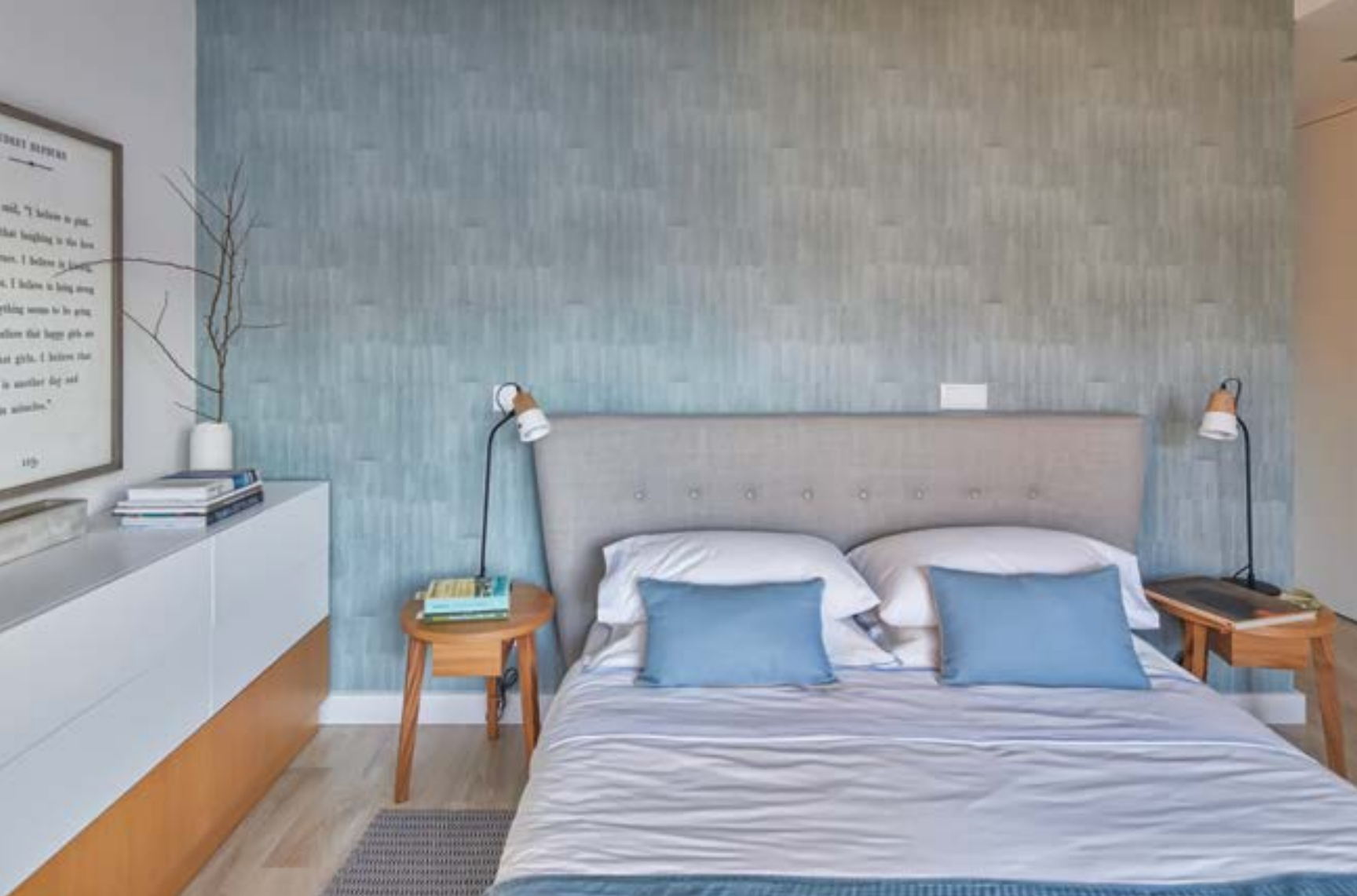
Cama, papel de parede, tapete, mesas de cabeceira e cómoda do Atelier Lúgia Casanova; roupa de cama da Zara Home, quadro e candeeiros Casanova Store