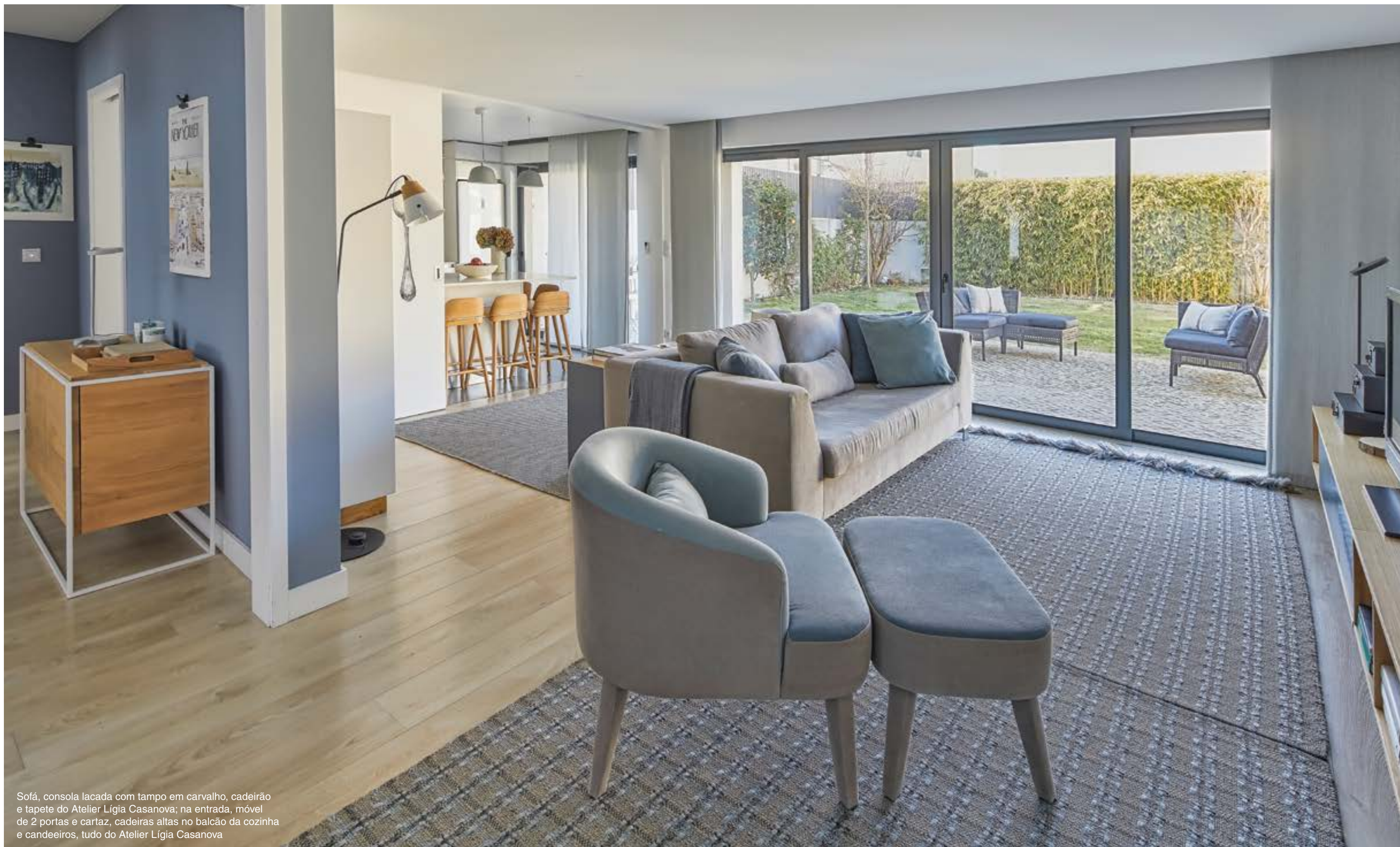
Sofá, consola lacada com tampo em carvalho, cadeirão e tapete do Atelier Lúgia Casanova; na entrada, móvel de 2 portas e cartaz, cadeiras altas no balcão da cozinha e candeeiros, tudo do Atelier Lúgia Casanova