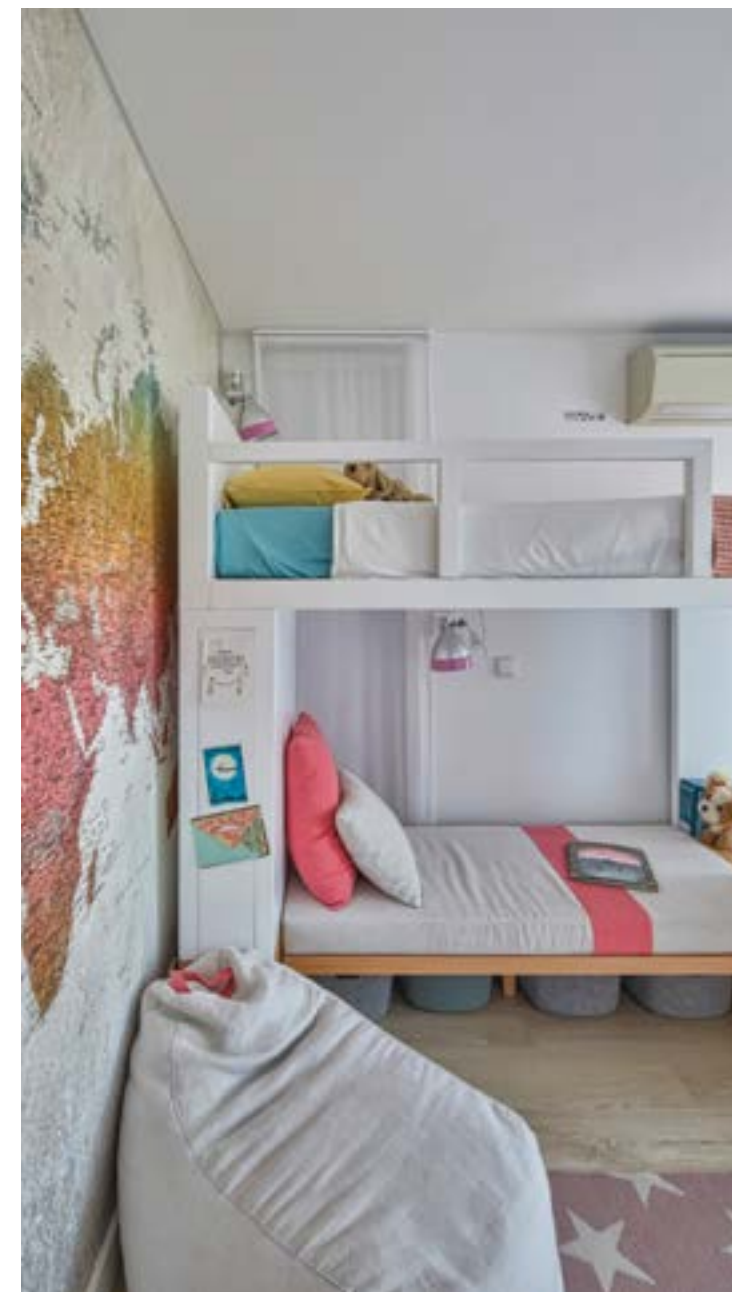
Beliche, cadeira, pufe e tapete do Atelier Lúgia Casanova; papel parede da Casanova Store e roupa de cama da Zara Home